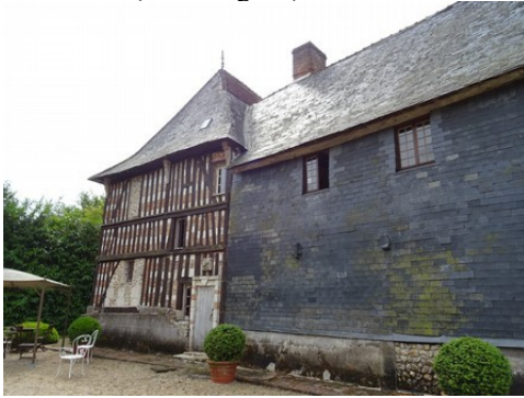
La façade arrière (habillage d'ardoises)