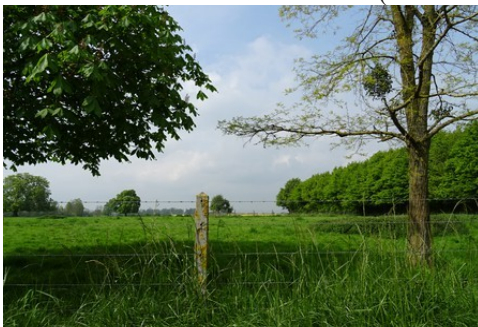
Le paysage alentours

Les avis seront cohérents avec ceux émis ces derniers années, à savoir : pas de maisons à volume compliqué (type V, W, Y, ou Z), Rez-de-chaussée + Combles, pentes à 45° pour les volumes principaux, ardoise ou tuile plate de teinte brun vieilli, à 20u/m 2 , avec un débord de toiture de 20cm, enduit de teinte beige clair avec modénatures (au choix : chaînages, encadrement de fenêtres, soubassement, colombage...). *Voir autres fiches.