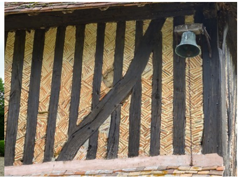
Les matériaux en façade (détail)