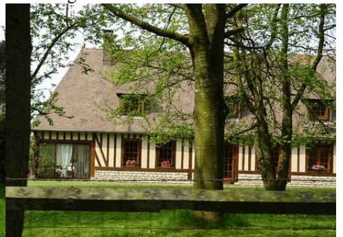
Un exemple d'architecture rurale