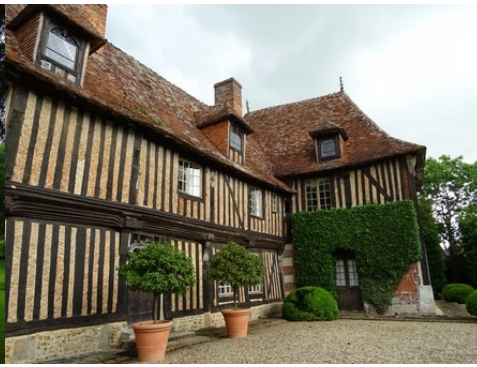
Le manoir (vue rapprochée)