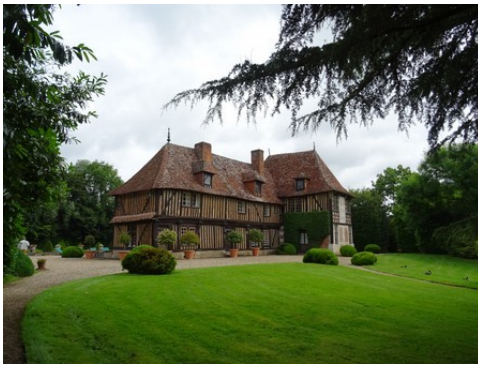
Le manoir (vue éloignée)