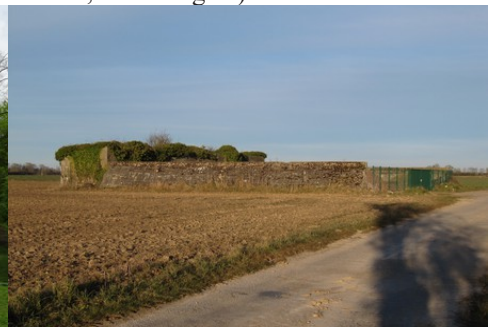
Un vestige de l'aérodrome allemand