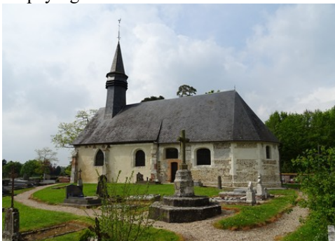
L'église de Barville en Lieuvain