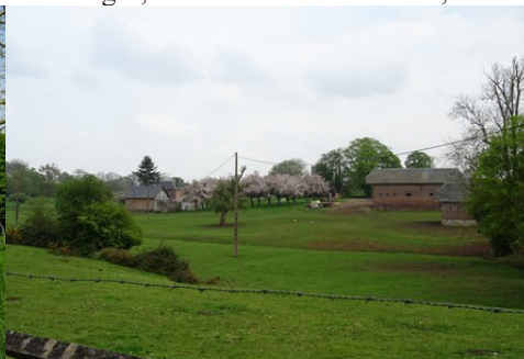
Une ferme et son verger