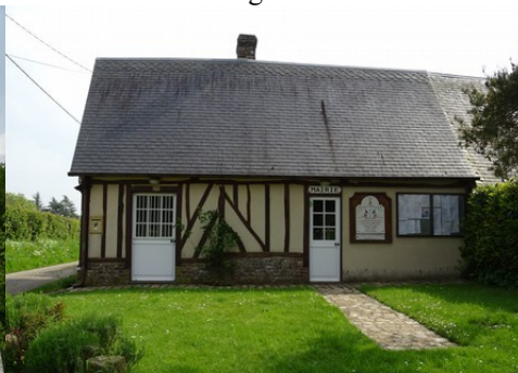
La mairie de Barville en Lieuvain